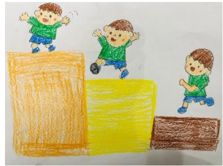
すてっぷのロゴ (子どもが描きました!)