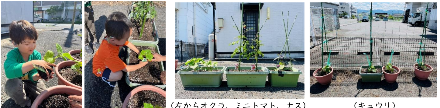
(左からオクラ、ミニトマト、ナス)

今年も施設の北側の空きスペースを使って、プランターで野菜を栽培しています。今年の野菜はミニトマト、ナス、キュウリ、オクラです。幼稚部の子どもたちが上手に苗を植えてくれました。野菜ができたら、子どもたちが収穫して持ち帰ります。料理したり食べたりした様子を教えてください！